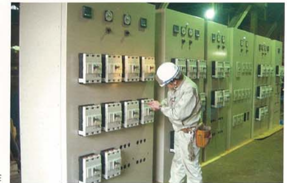
機器動力盤・制御盤の製作