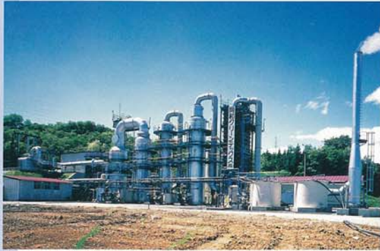
産業廃棄物（廃油、廃酸、アルカリ、 廃材各種）焼却プラント