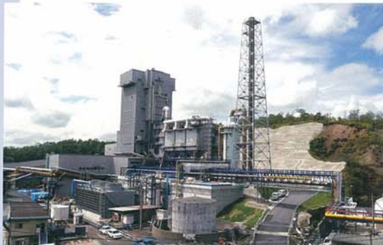
廃基板等多種原料に対応した 金属溶解プラント