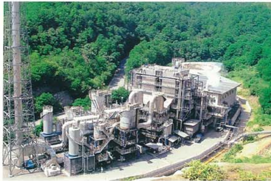
自動車シュレッダーダスト焼却 による金属及び蒸気回収プラント