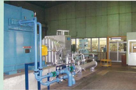
製錬・溶解炉廃熱利用 蒸気タービン保守